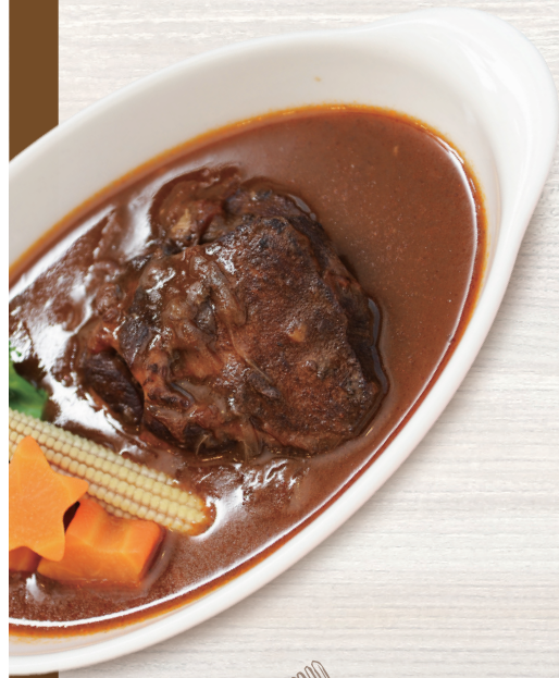
仔牛のタンシチュー

「特別」だったイタリアンやフレンチを 「日常」で楽しんでいただく、 そんな新しいカタチのオードブル店です。