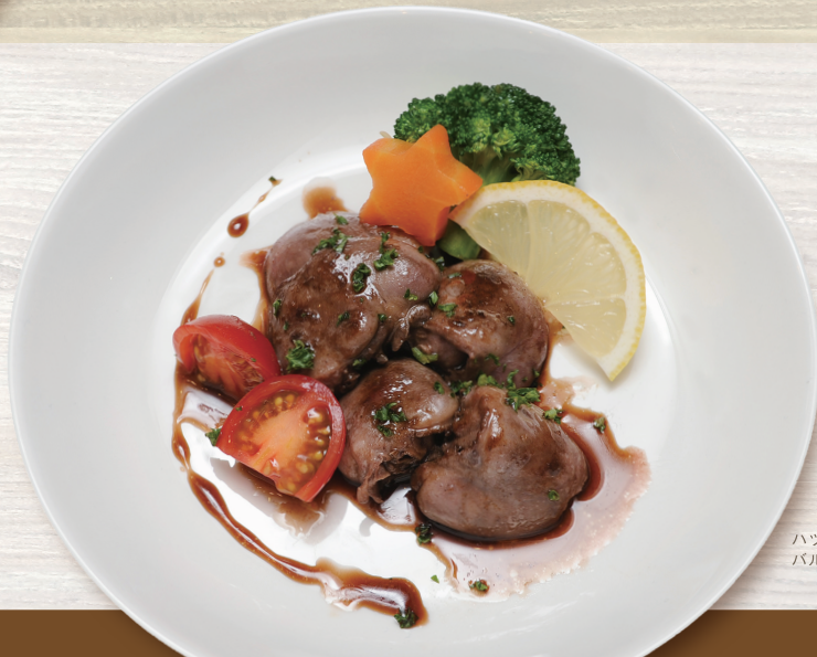
ハツの バルサミコソテー