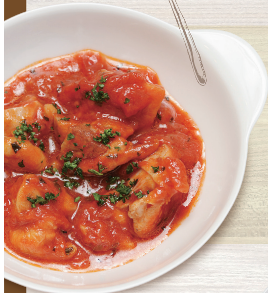
鶏モモ肉のトマト煮